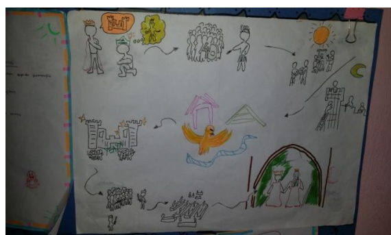
Gambar 6 dan 7: Hasil perbincangan murid Cikgu Siti yang dibuat dalam bentuk peta minda serta kartun untuk dibentangkan dalam sesi pengajaran KOMSAS

Perbincangan kumpulan dipilih dan diaplikasikan oleh kedua-dua guru cemerlang untuk menjelaskan kandungan teks KOMSAS. Tahap pemahaman dan penguasaan bahasa yang tinggi membolehkan penggunaan media berjaya dan berkesan dalam sesi pengajaran. Namun, penggunaan aktiviti lain antara Cikgu Ali dan Cikgu Siti adalah berbeza. Cikgu Ali sering menjalankan aktiviti seperti pembelajaran atas talian, merakam video, dan lakonan dalam sesi pengajaran seperti yang ditunjukkan dalam petikan temu bual berikut: