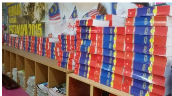
Gambar 4: Kamus yang disediakan semasa pengajaran KOMSAS bagi menyemak maksud kosa kata

Selain bahan edaran, Cikgu Siti juga berpendapat bahawa kamus berperanan penting dalam pembelajaran KOMSAS kepada seseorang murid. Murid perlu menyemak kamus untuk mencari maksud perkataan yang susah difahami khususnya perkataan klasik yang terkandung dalam kamus. Pendapat Cikgu Siti ditunjukkan dalam petikan berikut: