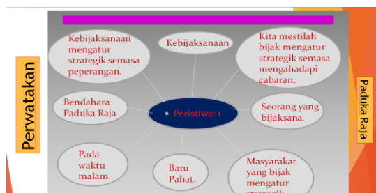
Gambar 5: Hasil kerja pembentangan dalam slaid powerpoint oleh murid Cikgu Ali yang dibuat mengikut peta i-Think untuk menerangkan prosa klasik Burung Terbang Dipipiskan Lada. Murid yang telah membincangkan isi dan ulasan prosa ini akan membentangkan hasil perbincangan di dalam kelas.

“...aktiviti perbincangan yang selalu. Mereka boleh fahamkan teks sendiri dan bentang di depan. Bincang berdasarkan teks sastera. Cikgu bagi tajuk, topik, mereka bincang. Cari persoalan, plot, nilai, perwatakan. Tulis pada kertas sebak, lepas tu bentang. Mereka ke arah berfikir. Pembentangan, perbincangan dengan ahli kumpulan. Pembentangan akan saya ambil sebagai ujian lisan.” (Cikgu Siti, TB3/53-58)