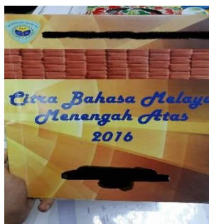
Gambar 3: Modul yang diselenggara oleh Cikgu Siti untuk pengajaran KOMSAS

“Cikgu memang ada banyak modul. Cikgu akan kombinasikan soalan KOMSAS ikut format peperiksaan, SPM sebenar, percubaan, latihan buku-buku.” (Cikgu Siti, TB3/12-15)